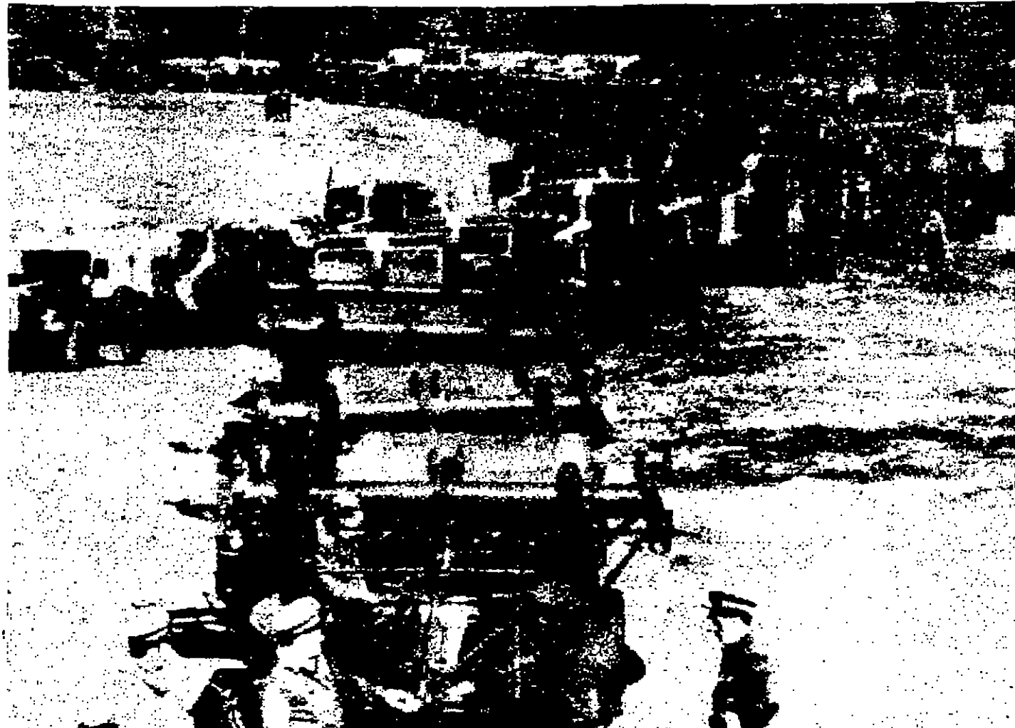
القوات المقاتلة التي ساعدت في احتلال تشيكوسلوفاكيا ضمن قوات حلف وارسو فلنادر العاصمة التشيكية حسب خطة الاستحباب التي تم التوصل اليها مؤخرا

حين مر الرئيس ديغول وزوجته على رأس موكب كبير من السيارات بين ذلك الجاهز التي اصطلت على جناب الطريق... ورحب الرئيس صوناي في كلمة القاها في المطار بالرئيس ديغول ووجهه بقية هندي وسياسي يمتنع بحضور كبير في بلنا... وبعقد الرئيس ديغول سلسلة من المحادثات السياسية خلال زيارته... ونظر ان نجل الاحداث الاخرة في تشيكوسلوفاكيا وازمة الشرق الاوسط... وكان الصدارة في المحادثات بالمشقة الى البحث في الحشد البحري الروسي في البحر الابيض المتوسط... ونزل تركيا ان يصدر من الرئيس الفرنسي بيان يدين طلبها الانضمام الى السوق الأوروبية المشتركة وموقفها من قضية قبرص... وقال الرئيس ديغول في خطاب القاها في المطار ان فرنسا لا تفر في وضع تركيا الاستراتيجي في العلم وبقضايا بحرية من الخطر الى الخطر ان تفر من سياستها الخارجية... وسياسة انقرة.